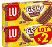
Grany Biscuit Chocolat X2