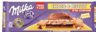
MILKA CHOCO BISCUIT XL 300G