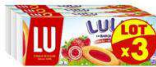
BARQUETTE FRAISE 3X120G