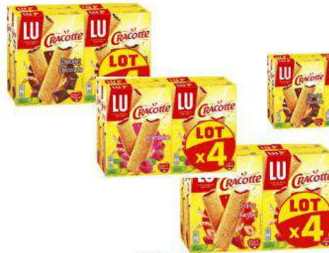
CRACOTTE CHOCO / FRAMBOISE / FRAISE 4x200G