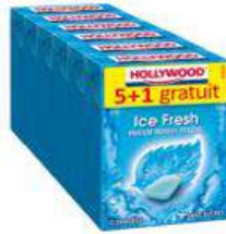
HOLLYWOOD ICE FRESH