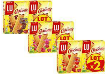
CRACOTTE CHOCO / FRAMBOISE / FRAISE 2X200GR