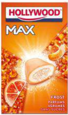
HOLLYWOOD MAX AGRUMES