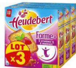
HEUDEBERT FORME 3X280G