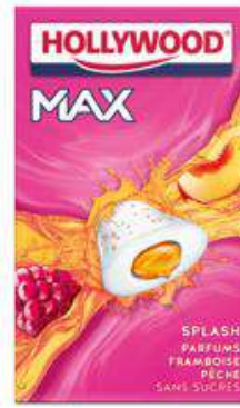
HOLLYWOOD MAX FRAMBOISE PECHÉ