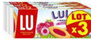
BARQUETTE FRAMBOISE 3X120G