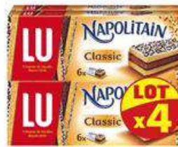
NAPOLITAIN CLASSIC LOTX4