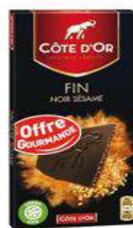
COTE D'OR NOIR SESAME 100G