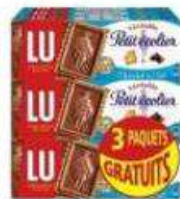
PETIT ECOIER LAIT 6 + 3 X150G