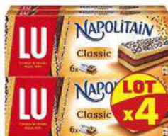
NAPOLITAIN CLASSIC 4X180G