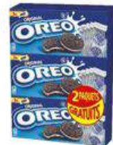
OREO ORIGINAL POCKET VANILLE 200G