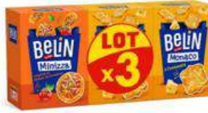
BELIN MONACO MINIZZA 285G