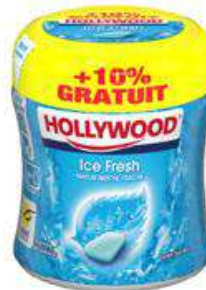
HOLLYWOOD BOITE ICE FRESH