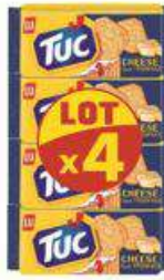
TUC FROMAGE 4X100G