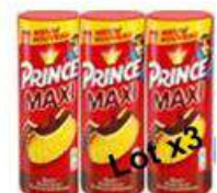
PRINCE MAXI X3