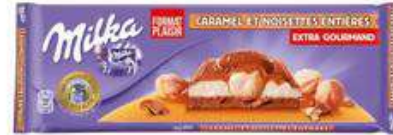
MILKA 300G CARAMEL ET NOISETTES ENTIERES