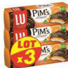
PiM's ORANGE 3X150G