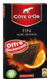
COTE D'OR NOIR ORANGE 100G