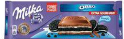
MILKA OREO XL 300G