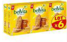
BELVITA BRUT 6X400G