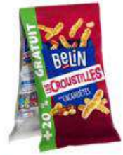
BELIN CROUSTILLES CACAHUETES 2X140G