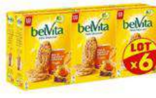
BELVITA MIEL 6X435G