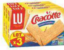
CRACOTTE Céréales Complètes 3X250G