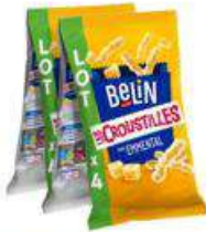
BELIN CROUSTILLES EMMENTAL 4X140G