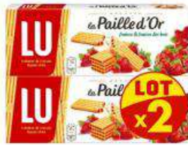
PAILLE D'OR FRAISE 2X170G