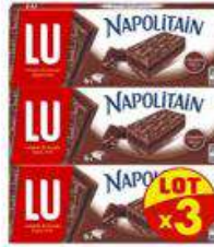
NAPOLITAIN CHOCOLAT 3X174G