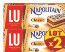
NAPOLITAIN CLASSIC 2X180G