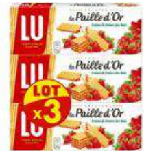
PAILLE D'OR FRAISES ET FRAISES DES BOIS 3X170G