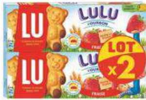
LULU L'OURSON FRAISE 2X150G