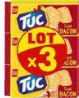
TUC BACON 3X100G