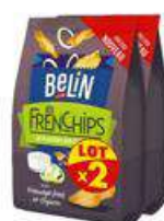
BELIN FRENCHIPS FROMAGE OIGNON 2X100G