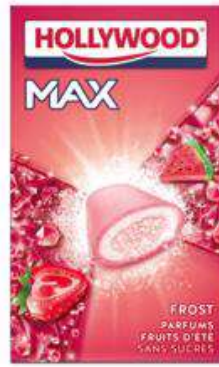
HOLLYWOOD MAX FRUITS D'ETE