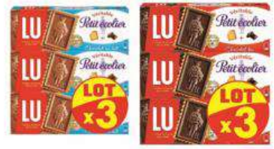
PETIT ECOIER LAIT / NOIR 3X150G