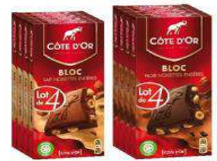
COTE D'OR BLOC LAIT NOISETTE 4X189G