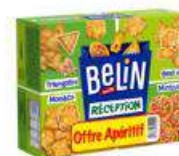
Assortiment Monaco 340gr et réception 380gr