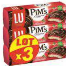
PiM's FRAMBOISE 3X150G