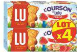
LULU L'OURSON FRAISE 4X150G