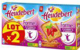
HEUDEBERT FORME 2X280G