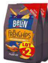
BELIN FRENCHIPS POULET 2X100G