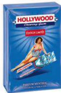
HOLLYWOOD VINTAGE MENTHOL