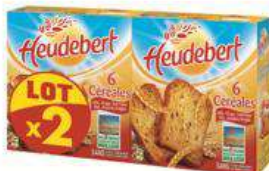
HEUDEBERT 6 CEREALES 2X3000G