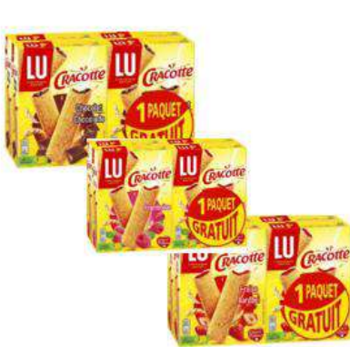
CRACOTTE CHOCO / FRAMBOISE / FRAISE 2X200G