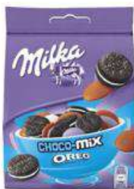
MILKA CHOCOMIX OREO 146G