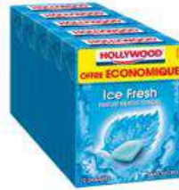
HOLLYWOOD ICE FRESH