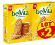
BELVITA BRUT 2X400G