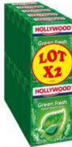
HOLLYWOOD GREEN FRESH