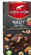
CO Noir Noisette et Amande 180gr