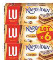
NAPOLITAIN CLASSIC 6X180G