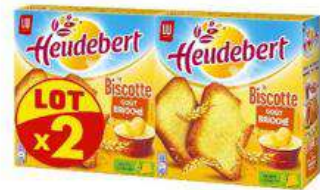
HEUDEBERT BISCOTTE 2X290G