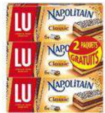
NAPOLITAIN CLASSIC 6X180G