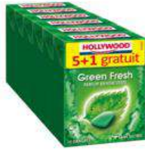
HOLLYWOOD GREEN FRESH