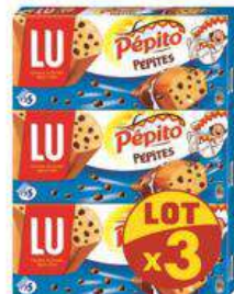
PEPITO PEPITE LOT X3