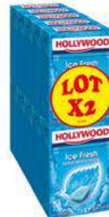
HOLLYWOOD ICE FRESH