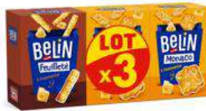
BELIN MONACO - FEUILLETE 285G