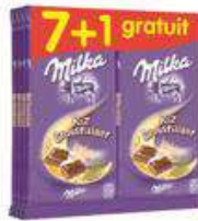
MILKA RIZ 8X100G 7+1