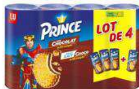
PRINCE LAIT CHOCO 4X300G