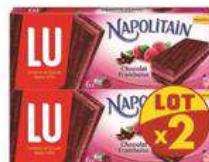
NAPOLITAIN FRAMBOISE 2X174G