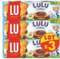
LULU L'OURSON CHOCOLAT 3X150G