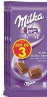
MILKA LAIT 600G