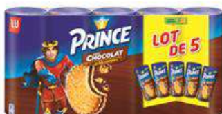
PRINCE POCKET CHOC 5X300GR