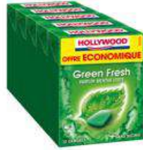
HOLLYWOOD GREEN FRESH