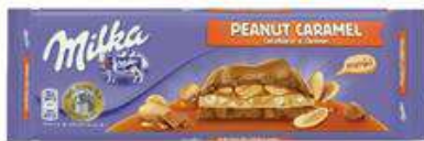
MILKA CACAHOUHETE 276G