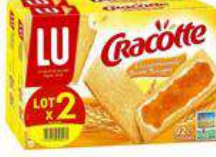
CRACOTTE GOURMANDE 2X250G