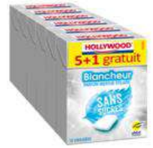
HOLLYWOOD BLANCHEUR MENTHE POLAIRE