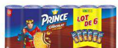
PRINCE CHOCOLAT 6X300G