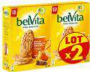
BELVITA MIEL 2X400G