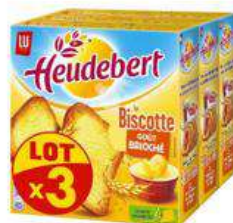
HEUDEBERT BISCOTTE 3X290G