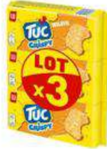
TUC CRISPY 3X100G