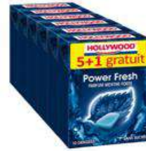
HOLLYWOOD POWER FRESH