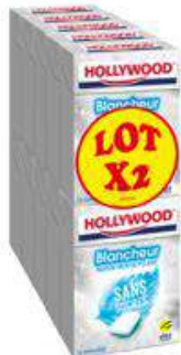
HOLLYWOOD BLANCHEUR MENTHE POLAIRE