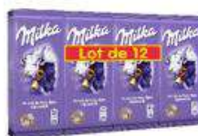
MILKA LAIT 12X100G