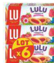
BARQUETTE FRAMBOISE 6x120G