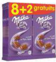
MILKA LAIT 10X100G 8+2