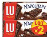
NAPOLITAIN CHOCOLAT 2X174G