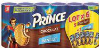
PRINCE CHOCOLAT - VANILLE 6X300G