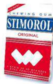
Stimorol Original Menthe/Réglisse