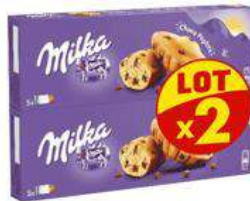
MILKA CHOCO PEPITES 2X140G