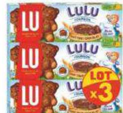
LULU L'OURSON TOUT CHOCOLAT 3X150G