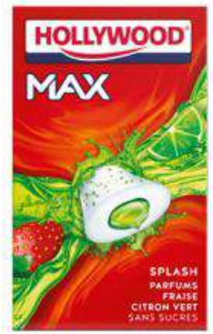
HOLLYWOOD MAX FRAISE CITRON