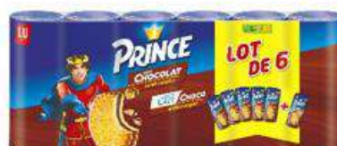
PRINCE LAIT CHOCO-VANILLE 6X300G