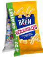
BELIN CROUSTILLES EMMENTAL 2X140G