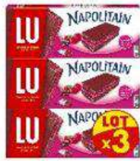
NAPOLITAIN FRAMBOISE 3X174G