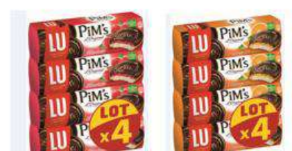
PiM's FRAMBOISE / ORANGE 4X150G