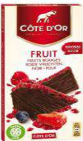
COTE D'OR FRUIT ROUGE 130G