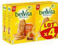
BELVITA MIEL 4X435G