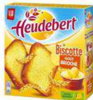
HEUDEBERT BISCOTTE 290G