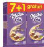
MILKA RIZ 8X100G 7+1