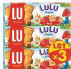
LULU L'OURSON FRAISE 3X150G