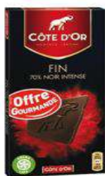
COTE D'OR NOIR 70% 100G