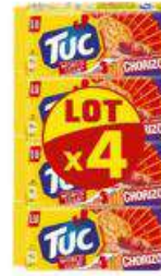
TUC 100G CHORIZO 100G