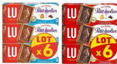
PETIT ECOIER LAIT / NOIR 6X150G