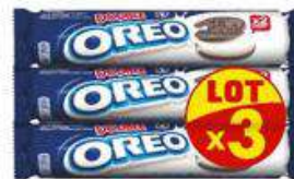
OREO DOUBLE CREME 3X157G