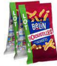
BELIN CROUSTILLES CACAHUETES 4X140G