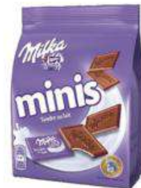
MILKA MINIS TENDRE LAIT 10X20G