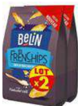
BELIN FRENCHIPS ORIGINAL 2x100G