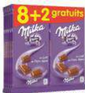
MILKA LAIT 10X100G 8+2