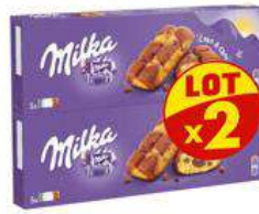
MILKA CAKE AND CHOC 2X175G