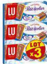
PETIT ECOIER TENDRE COEUR 120GX3