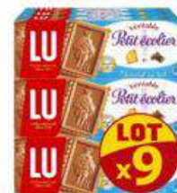
PETIT ECOIER NOIR LOT x9