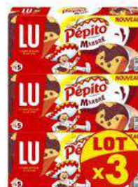
PEPITO MARBRE PEPITE LOT X3