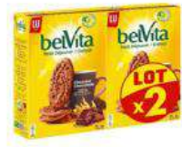
BELVITA CHOCOLAT 2X400G