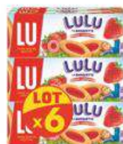
BARQUETTE FRAISE 6x120G