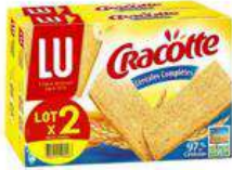
CRACOTTE CEREALES 2X250G