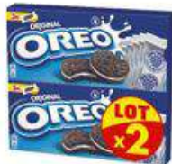
OREO POCKET VANILLE 2X220G