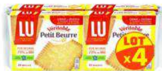
VERITABLE PETIT BEURRE 4X200G