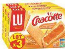
CRACOTTE GOURMANDE 3X250G