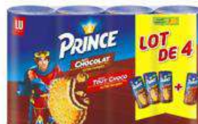
PRINCE TOUT CHOCO 4X300G