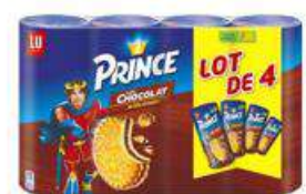
PRINCE GOUT CHOCOLAT 4X300G