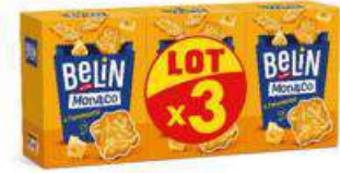
BELIN MONACO 3X100G