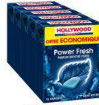
HOLLYWOOD POWER FRESH