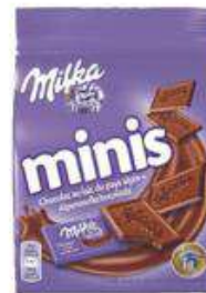
MILKA MINIS LAIT 10X20G