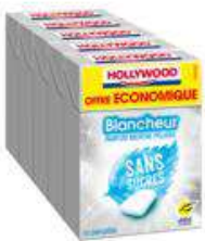
HOLLYWOOD BLANCHEUR MENTHE POLAIRE