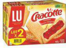
CRACOTTE FROMENT 2X250G