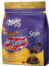
MILKA SNAX DAIM 145G