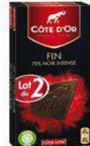
COTE D'OR 2X100G NOIR INTENSE