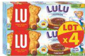
LULU 4 CHOCOLAT 4X150G