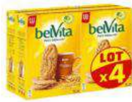
BELVITA BRUT 4X400G