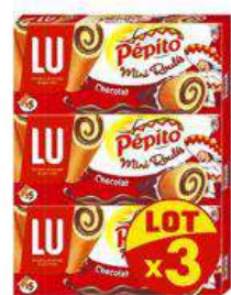
PEPITOMINI ROULES CHOCOLAT 3X150G