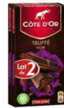
COTE D'OR NOIR TRUFFE 380G