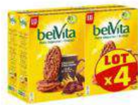
BELVITA CHOCOLAT 4X400G