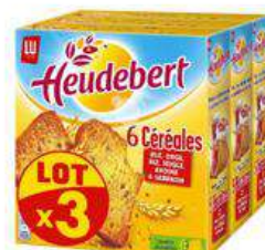
HEUDEBERT 6 CEREALES 3X300GR