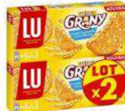
Grany Biscuit Brut Céréales X2