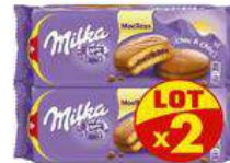
MILKA CHOC & CHOC 2X175G