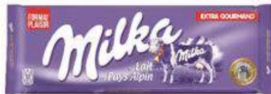
MILKA 300G LAIT PROMO