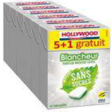
HOLLYWOOD BLANCHEUR MENTHE VERTE