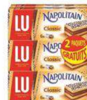
NAPOLITAIN CLASSIC 6X180G