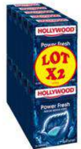
HOLLYWOOD POWER FRESH