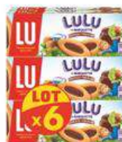
BARQUETTE CHOCOLAT 6x120G