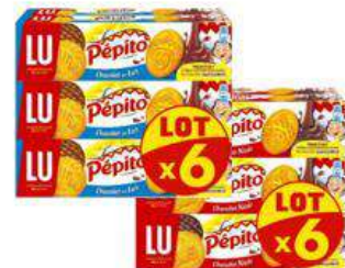
PEPITO NAPPE LAIT / NOIR X6