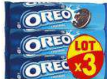
OREO ORIGINAL 3X154G