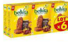
BELVITA CHOCOLAT 6X400G