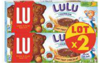
LULU L'OURSON TOUT CHOCOLAT 2X150G