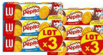
PEPITO NAPPE LAIT / NOIR X3