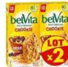
BELVITA CROOKIE 2X300G