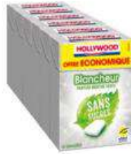
HOLLYWOOD BLANCHEUR MENTHE VERTE