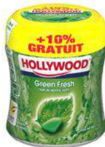
HOLLYWOOD BOITE GREEN FRESH