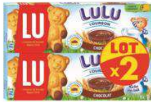
LULU L'OURSON CHOCOLAT 2X150G