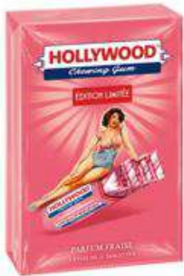
HOLLYWOOD VINTAGE FRAISE