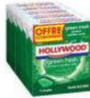
HOLLYWOOD GREENFRESH MENTE VERTE X5 OFFRE ECONOMIQUE