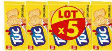
TUC SALE LOTX5