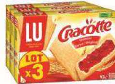
CRACOTTE FROMENT 3X250G