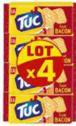
TUC BACON 4X100G