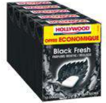
HOLLYWOOD BLACK FRESH