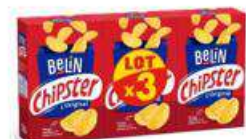
BELIN CHIPSTER LOT X 3