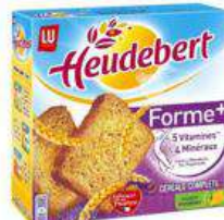
HEUDEBERT FORME 280G