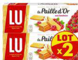
PAILLE D'OR FRAMBOISE 2X170G