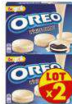
OREO ENROBE CHOCOLAIT LAIT / BLANC 2X292G